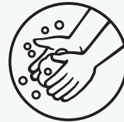
Ngaahi tō'onga haisini totonú